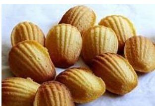
Erg lekker waren de Madeleine koekjes!

De opkomst was met bijna 100 leden zeer groot. Het is zeker voor herhaling vatbaar.